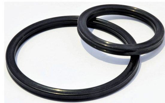
Die leistungsfähige Beschichtung OVE40SL auf Elastomeren erfordert porentiefe und verbrieftete Reinigung der Dichtungsringe

Für die Herstellung, die Veredelung und den Einsatz von Elastomerdichtungen bedeutet dies einen immer größeren Aufwand in der Herstellung sauberer und funktionsfähiger Teile; insbesondere, wenn die Baugruppen immer kleiner und leistungsfähiger werden und immer mehr Funktionalitäten innerhalb einer Baugruppe verbaut sind. Damit brauchen auch immer kleiner werdende Dichtungen eine besondere Behandlung, bevor sie ihren langlebigen Einsatz antreten dürfen.